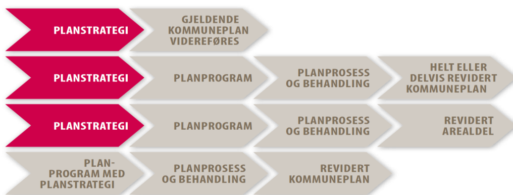
Figur 2: Illustrerer alternative løp til hvordan planstrategien kan følges opp gjennom kommuneplanlegging.

Det pågår i disse dager et omfattende kommunereformarbeid, der Rennesøy kommune har inngått 2 intensjonsavtaler med nabokommunene og i tillegg har utredet et nullalternativ, der kommunen fortsetter å eksistere som selvstendig kommune. Enten Rennesøy består som egen kommune eller blir del av en større kommune, er det viktig at kommunen har et godt og oppdatert planverk. Rådmannen ser det dermed som formålstjenlig å rullere kommuneplanen i denne valgperioden.