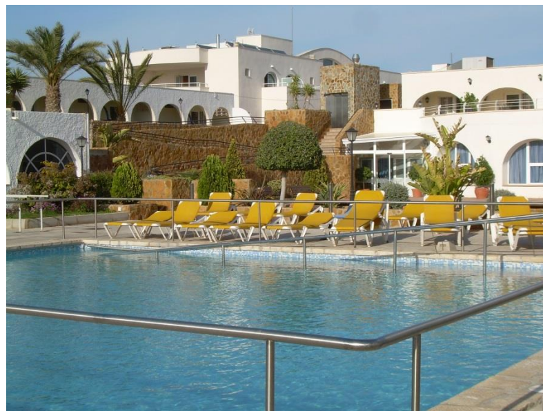
Solgården ved Villajoyosa, Costa Blanca

Medhjelpere fra Solgården og Høyskolen i Molde